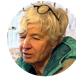
Text: Susanne Härrli