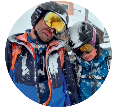
Tourenbericht St. Antönien, Partnun – Flexibilität statt Gipfelglück