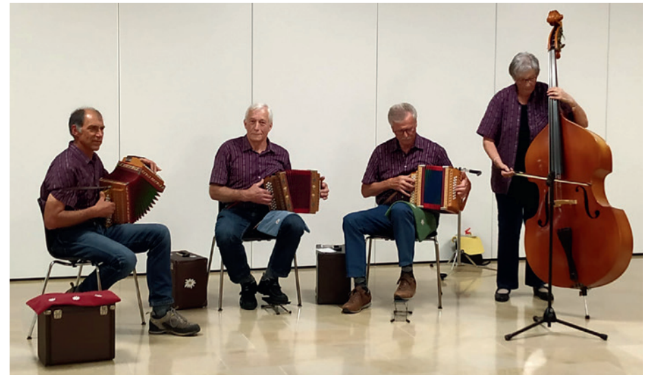
Quartett «Schwyzerörgeli-Fründe Wasserfallen»

Bitte meldet euch für das Fest und die «Touren» zur Waldweidhütte separat an.