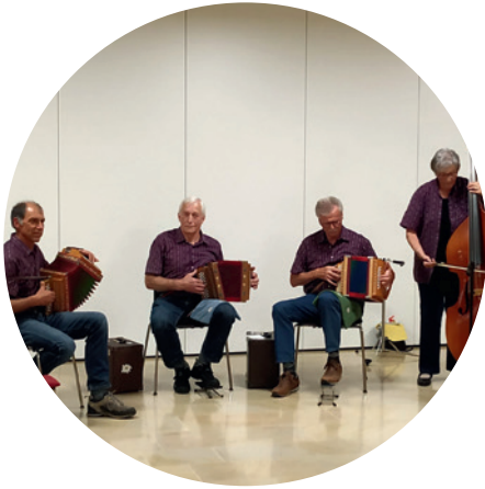
Sommerfest 2026 Waldweidhütte