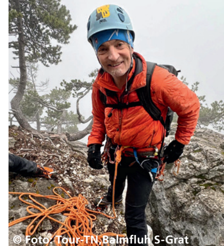
Balmfluh S-Grat