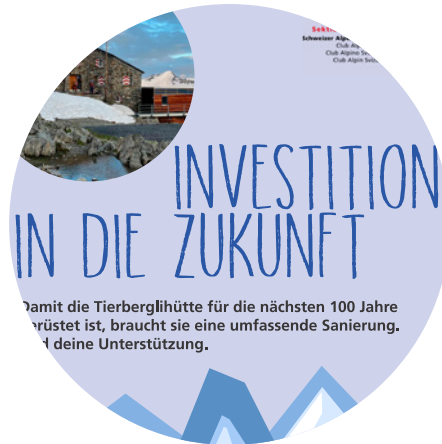
Investition in die Zukunft Tierberglhütte