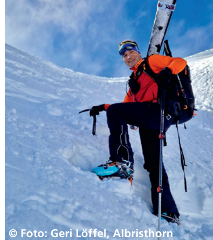
Albristhorn