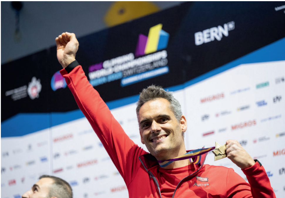
Weltmeisterschaften in Bern, 2023